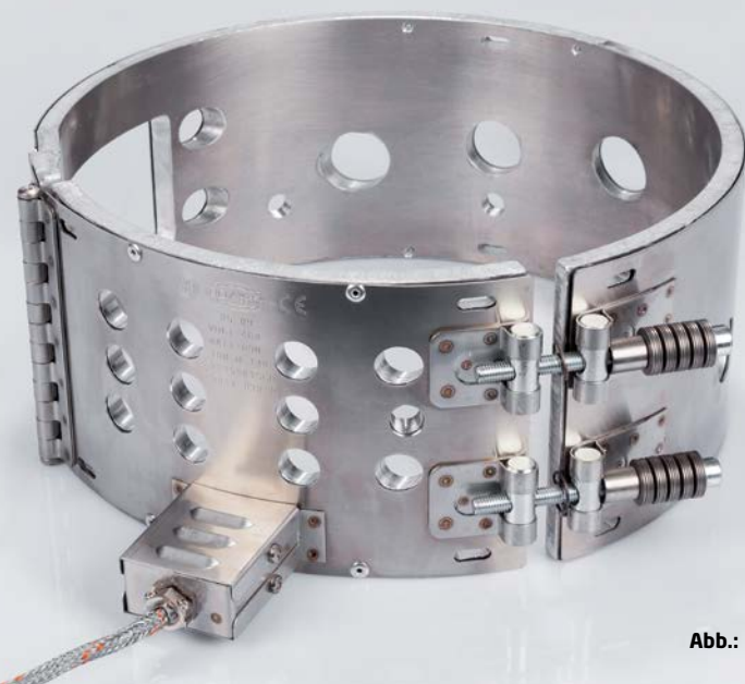
Abb.: Heizband Typ ZAK